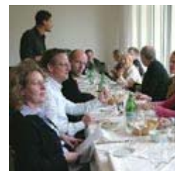
Hors d'oeuvre: Wer ist mein Gegenüber?

Vorsichtig schleichen sich einige gut gekleidete Menschen an diesem Mittwochmittag an das Restaurant "Op de Eck" an der Düsseldorfer Kunsthalle heran, ihr Gegenüber taxierend: "Sind Sie auch vom LunchClub?" Der skeptische Blick weicht dank positiver Antwort einem befreiten Lächeln: "Ich bin zum ersten Mal dabei." Pünktlichkeit ist eine Tugend und beim "LunchClub" wird sie groß geschrieben. Schließlich treffen sich hier Menschen, deren Zeit - in Geld bemessen - besonders kostbar ist: Führungskräfte, Selbständige, Unternehmer. Menschen, die auch die Mittagspause beruflich nutzen möchten.