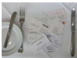
Welche Karte gehörte nochmal zu wem?